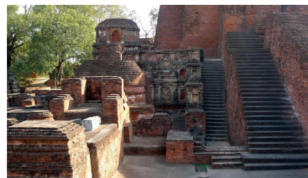
Восстановленные руины Наланды Махавихары