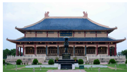
Мемориальный зал Хиуен Цанг