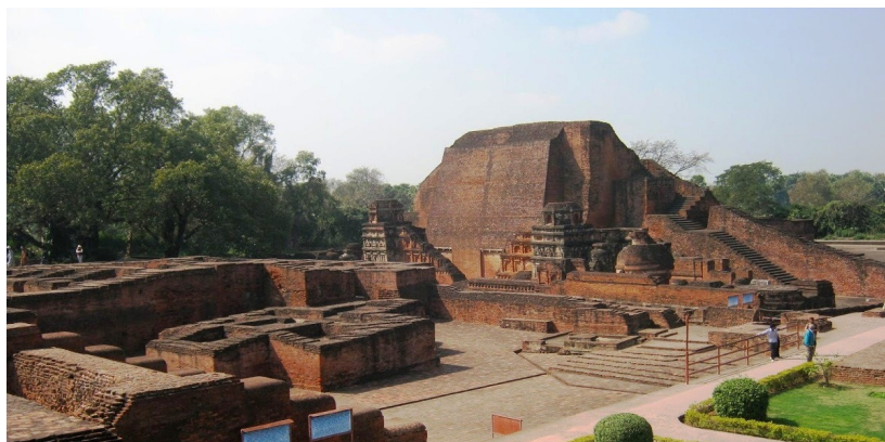
Восстановленные руины Наланды Махавихары

Мемориальный зал Хиуен Цанг - новое сооружение, построенное в память великого китайского путешественника, Хиуен Цанг.