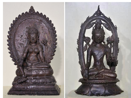
Археологический музей Наланды