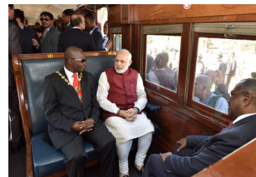
ПМ во время поездки на поезде в Питермаритсбург

Оба лидера определили сферы обороны, переработки сельхозпродукции, развития человеческих ресурсов, инфраструктуры, промышленности, добычи угля, минералов, возобновляемой энергетики, фармацевтики, туризма, науки-техники, а также финансовые услуги основными направлениями для более тесного сотрудничества. Южная Африка выразила интерес к сотрудничеству с Индией в рамках Программы «Операция Факиса», направленной на восстановление морской и судостроительной промышленности. Лидеры подчеркнули острую необходимость реформирования Совета Безопасности Организации Объединенных Наций и международных финансовых систем, а также международных усилий по борьбе с терроризмом.