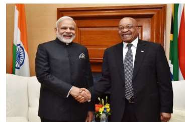
Премьер-Министр встречается с Президентом Джейкобом Зумой

Премьер-Министр Нарендра Моды совершил официальный визит в Южно-Африканскую Республику 7-9 июля 2016 года. Он встретился с Президентом Джейкобом Зумой в Претории 8 июля 2016 года. Президент Зума напомнил о поддержке, которую оказала Индия в борьбе за свободу, а также роли Махатмы Ганди. Он высоко оценил бесценный вклад народа Индии в развитии Южной Африки. Он радушно поддержал продление электронной туристической визы для Южной Африки. Он высоко оценил смягчение режима прямых иностранных инвестиций и призвал Южно-африканских инвесторов рассмотреть сферы обороны, финансов и фармацевтики для инвестиций в Индию. Премьер-Министр Моды поблагодарил Южную Африку за продление многократной визы сроком на 10 лет для бизнесменов из стран БРИКС.