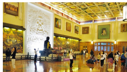
Нава Наланда Махавихара