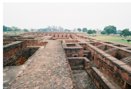
Восстановленные руины Наланды Махавихары